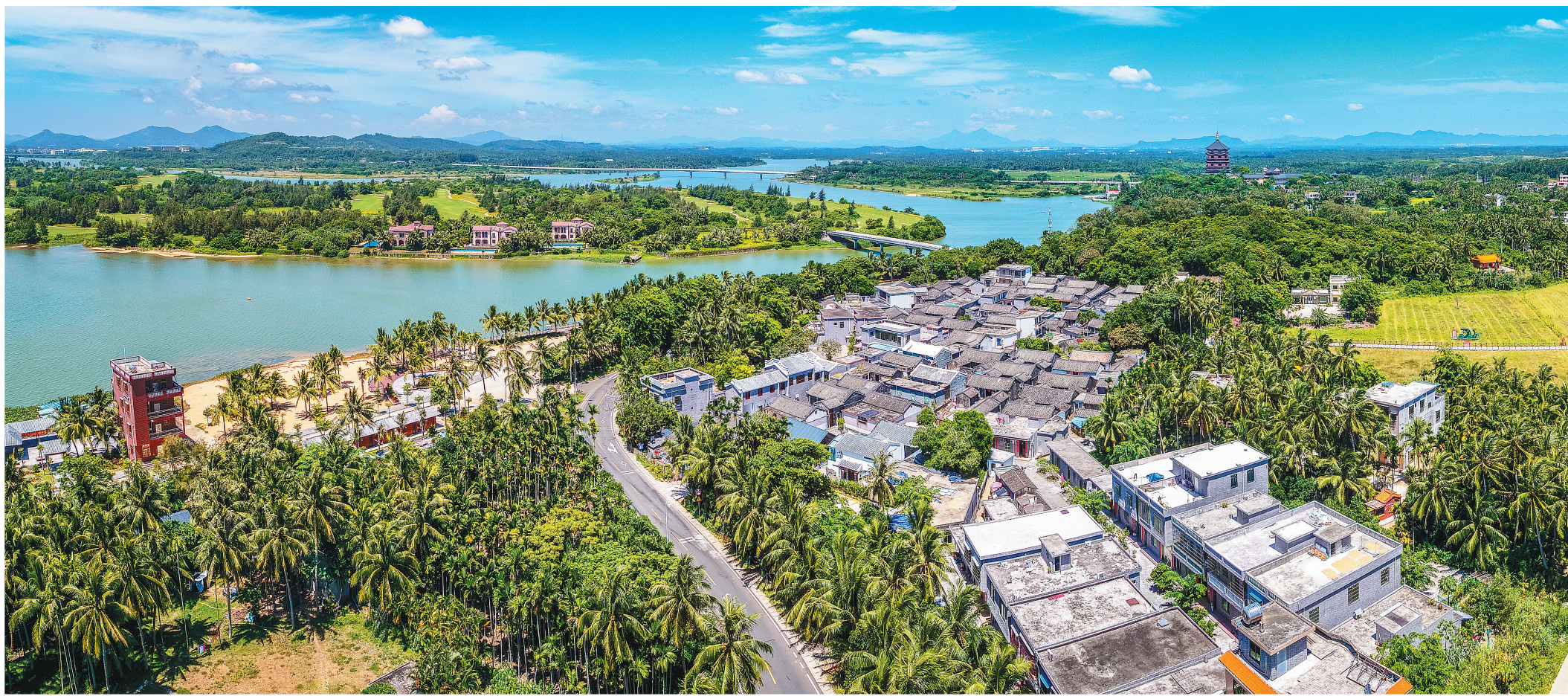
俯瞰博鳌镇南强村。琼海以党建带动美丽乡村建设,让一大批乡村焕发新颜。