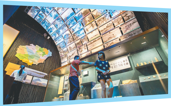
海南省民族博物馆。