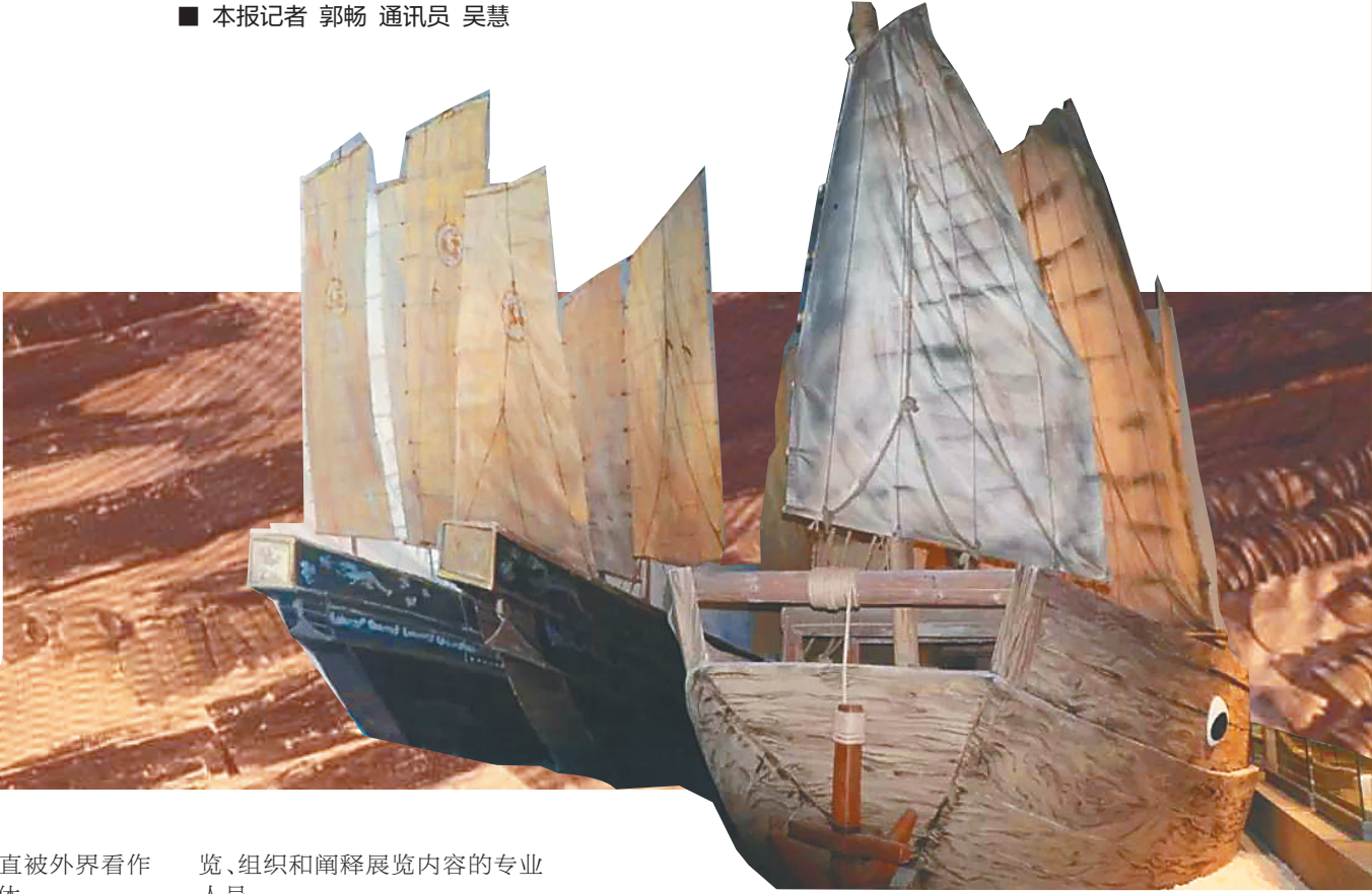
南海博物馆“丝路逐浪，南海之舟”。

近年来，全国各大博物馆的临时展览都受到观众热捧。海南省博物馆举办的临时展览次数逐年增多，临时展览为博物馆注入了新活力，也吸引了更多观众，一些热门临展，甚至出现了观众排队长参观的现象。民众的热捧，催生了策展人的热情，日前，国内各大博物馆策展人齐聚海南，召开当代中国博物馆策展人论坛，探讨如何丰富当下博物馆的展陈内容，尤其是临时展览、巡回展览、文创推介等内容的策划方向。