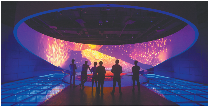
海南省博物馆。