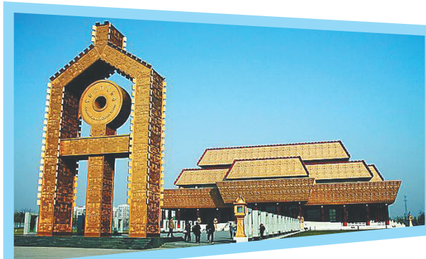
中国文字博物馆。(资料图)