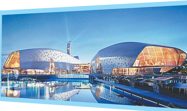
中国海事博物馆。(资料图)