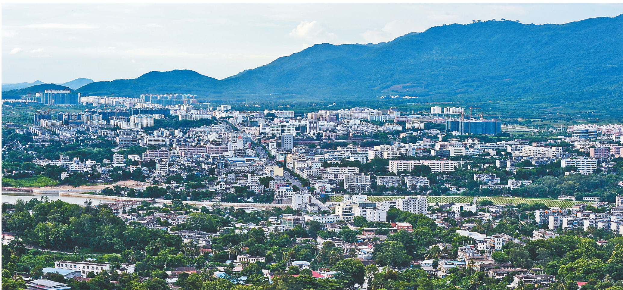
昌江县城石碌新貌。