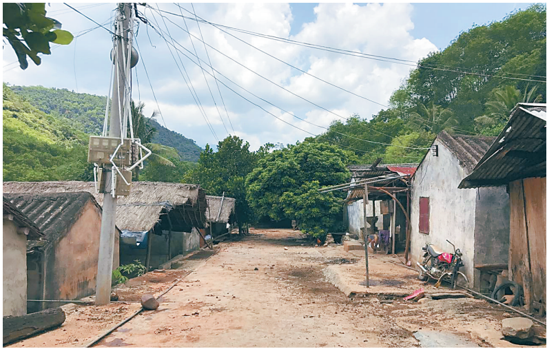
昌江王下乡浪论村旧貌。