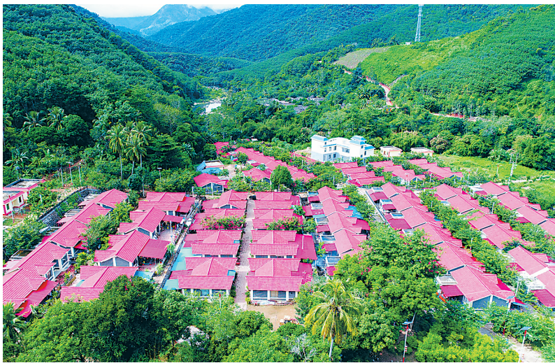
昌江王下乡浪论村新貌。