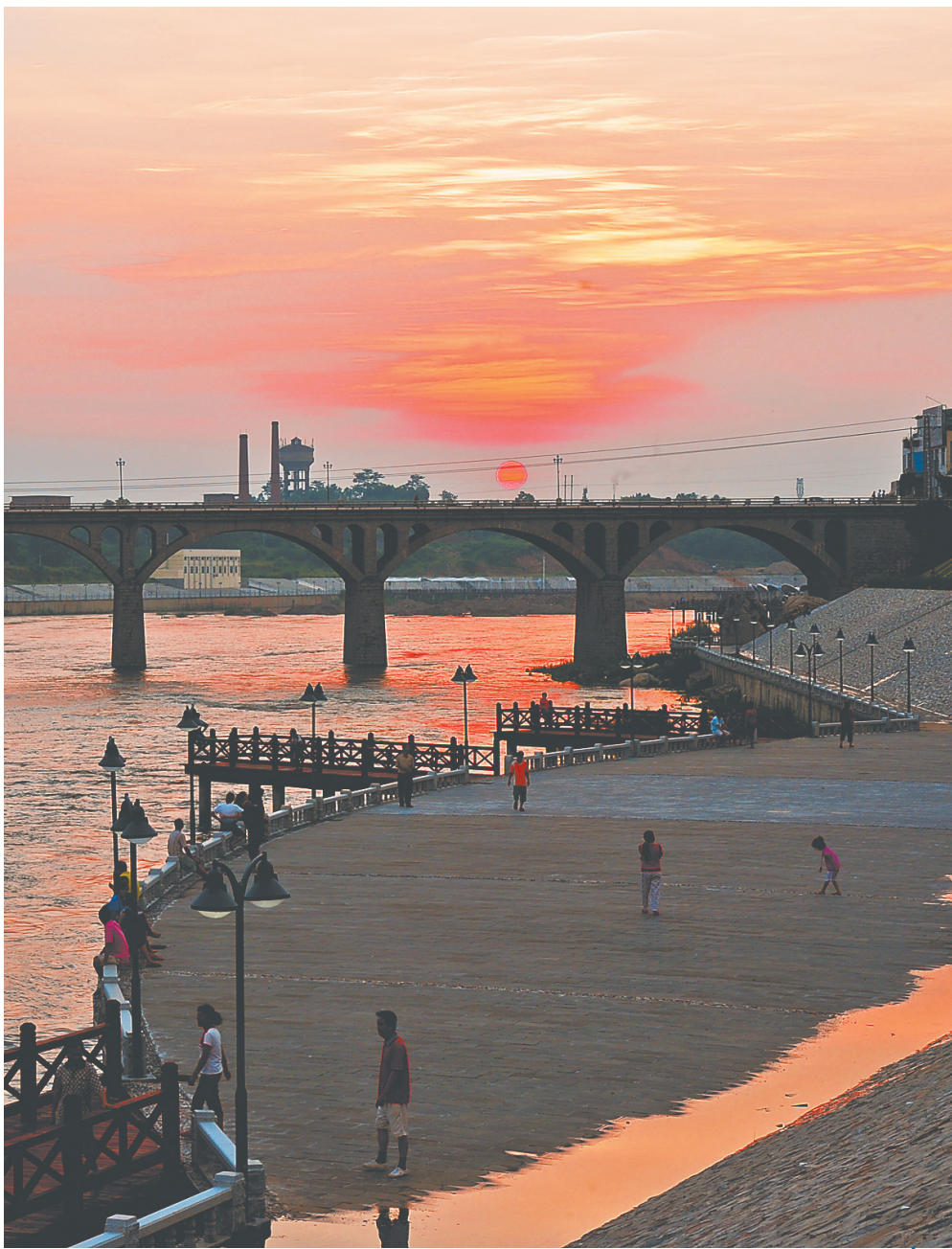
石碌镇石碌桥新貌。