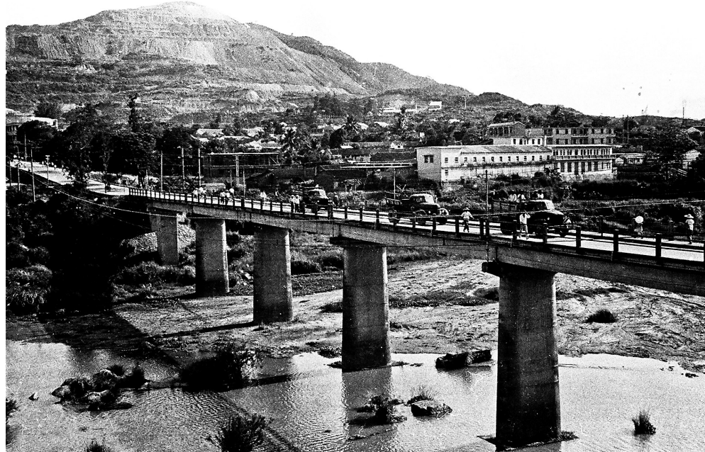
石碌镇石碌桥旧貌。