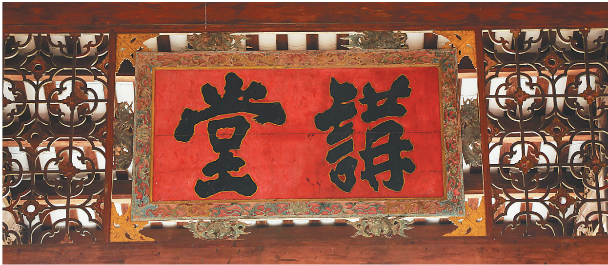
由潘存题写的溪北书院“讲堂”。

潘存何许人?可能包括大多数海南人在内,对这个名字都不太熟悉。诚然,他相对于海南古代四大才子——丘濬、王佐、海瑞、张岳崧在民间的声望还达不到妇孺皆知的地步。然而在海南文昌铺前镇的文北中学里,我们可以看到一座古香古色的溪北书院,这是潘存留给世间最好的遗产,“教育人才 维持风俗”,在大门两边的这八个大字,是潘存对家乡教育事业的殷切期望。