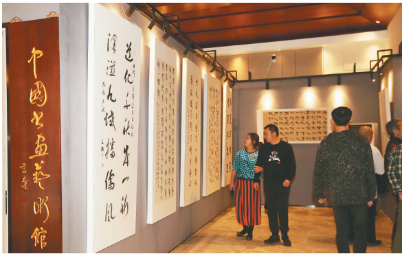
庆祝改革开放四十周年名家书画展。

“可以说这座古玉艺术馆是一座汉文化的宝殿，彰显了中华民族代代相传的文化基因。”知名文化学者言恭达说。