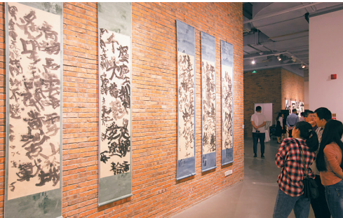
24日，《嵩山十方参学展》第34回在三亚举办，本次展出的144件作品包括油画、水墨、书法、篆刻等。

1000元)。赛后还设有民歌手机铃声推广活动、海南新民歌创作采风活动、海南民歌抖音秀以及新时代海南民歌创作传唱课堂、海南民歌文化进校园、进军营、下基层(文艺汇演)和海南民歌MV拍摄等系列活动。 2018中国(海南)民歌盛典由海南省委宣传部指导，海南日报报业集团、海南省文联共同主办，南海网及海南各市县宣传部、文体局联合承办，海南省音乐家协会、海南省民间文艺家协会协办。活动得到了海口海甸城购物中心大力支持。