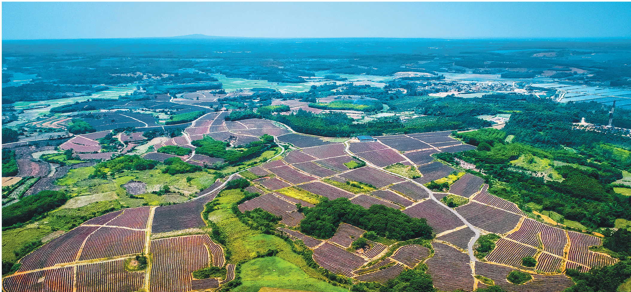
临高博厚镇新贤村千亩凤梨扶贫基地。