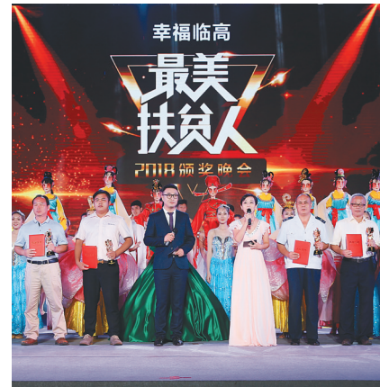
今年10月,“临高最美扶贫人”评选结果出炉。