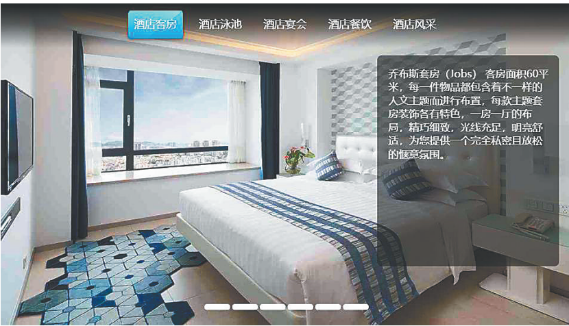
智慧酒店电视显示画面。