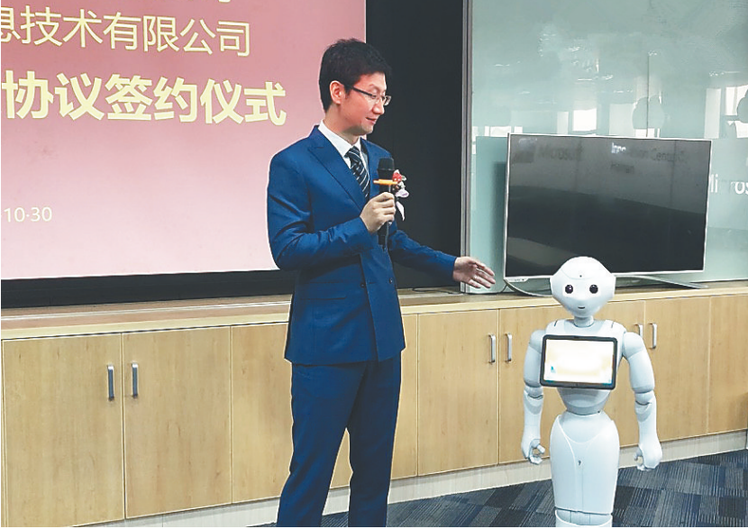
旅游机器人首次亮相。