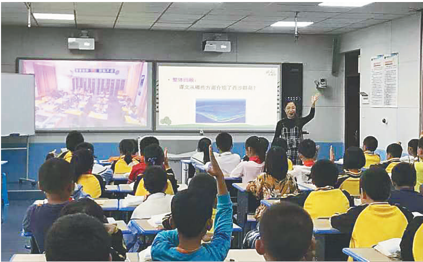
海口市滨海九小与海口美兰区演丰镇演丰小学同步课堂。