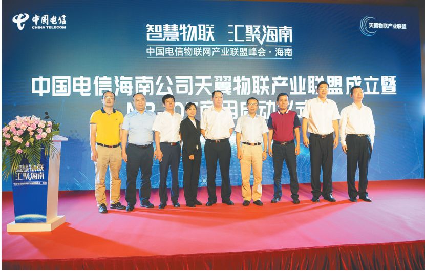
中国电信新一代物联网NB-IOT在海南正式商用。