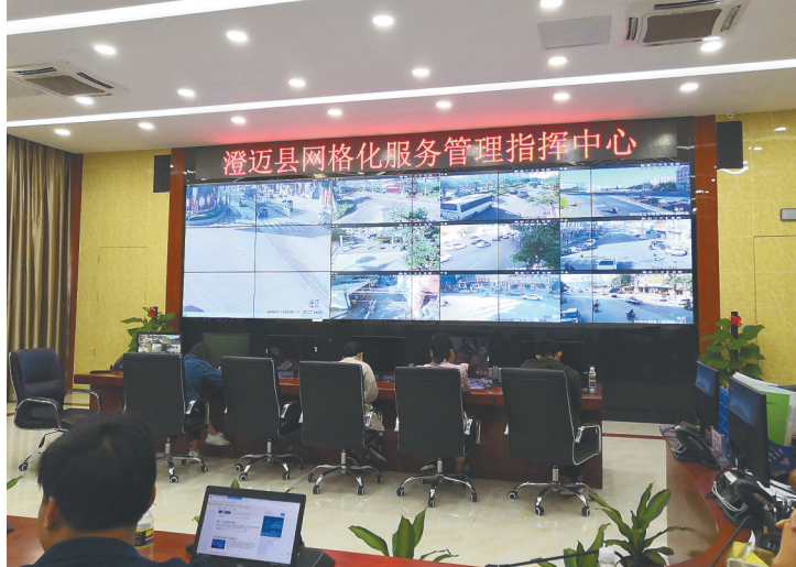
澄迈县网格化服务管理指挥中心。