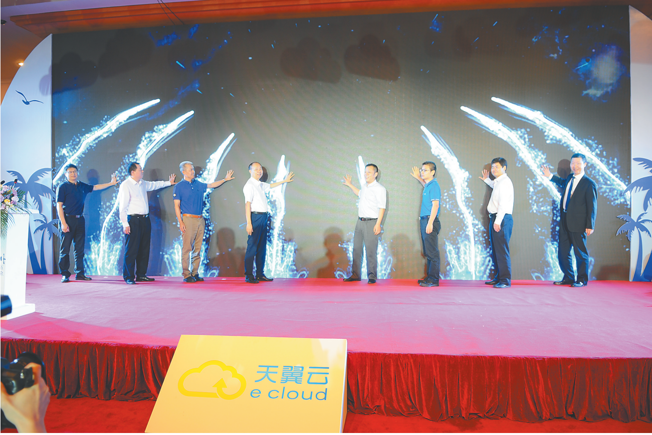
天翼云3.0海南节点暨企业上云发布会。

据介绍，“雪亮工程”是以县、乡、村三级综治中心为指挥平台、以综治信息化为支撑、以网格化服务管理为基础、以公共安全视频监控联网应用为重点的“群众性治安防控工程”，充分发动社会力量 and 广大群众共同参与治安防范，真正实现治安防控“全覆盖、无死角”。