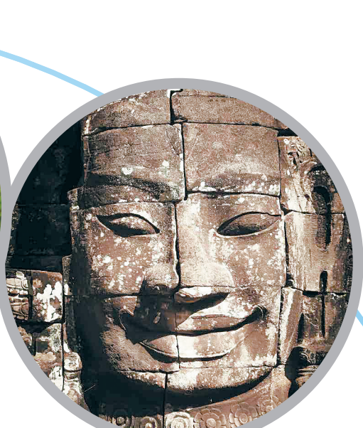
柬埔寨“高棉的微笑”。