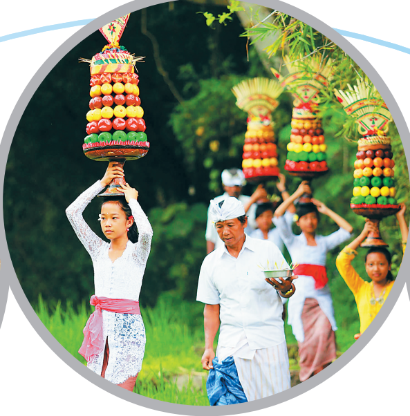
印度尼西亚乌布的田园乡间。