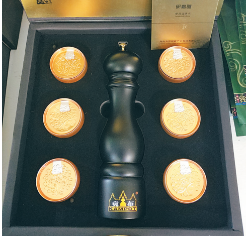
“贡布黑胡椒”。

省农业农村厅本次公布的农业产业化联合体还有海南海丰海洋牧场产业化联合体、海南天地人凤梨产业化联合体。截至目前，我省已创建9个农业产业化联合体，涉及农业经营主体100多个。