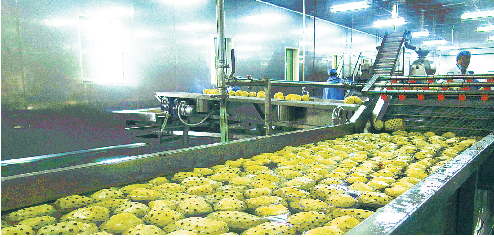
1月10日，海南农垦南绿果食品有限公司的果浆加工生产线，一个个菠萝被削去了皮。

据了解，接下来，该活动将陆续走进海垦红昇农场公司、海垦东路农场公司、海垦东新农场公司、海垦东昌农场公司等企业。