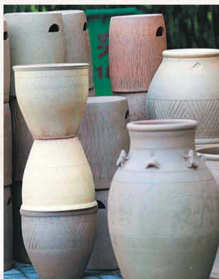
昌江保突村的黎陶产品。