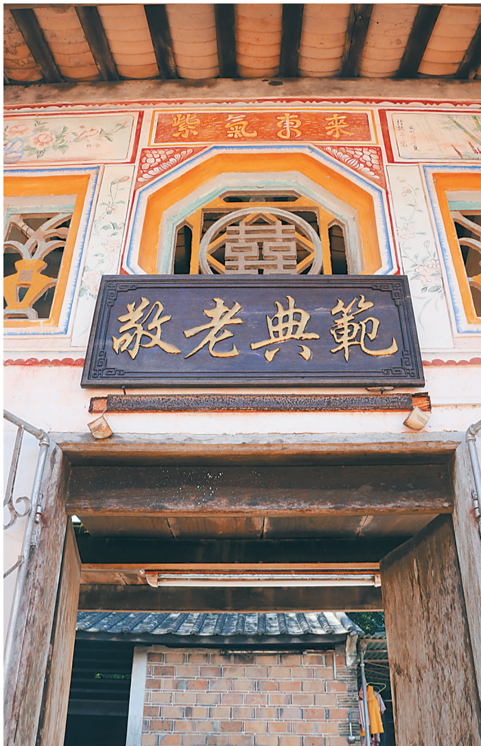
文昌茂园村敬老典范。

在文昌市公坡镇，一个百年古村——茂园村，成为我省琼东地区远近闻名的村落。它的出名不在于这个村庄建设得有多么富美，事实上茂园村的风貌也仅仅算得上是古朴田园，但特殊在于，百年前从大陆飘洋来此扎根、仅有20余户的茂园村人，一百多年来，竟传承了多达数以百计的孝道爱美德故事。