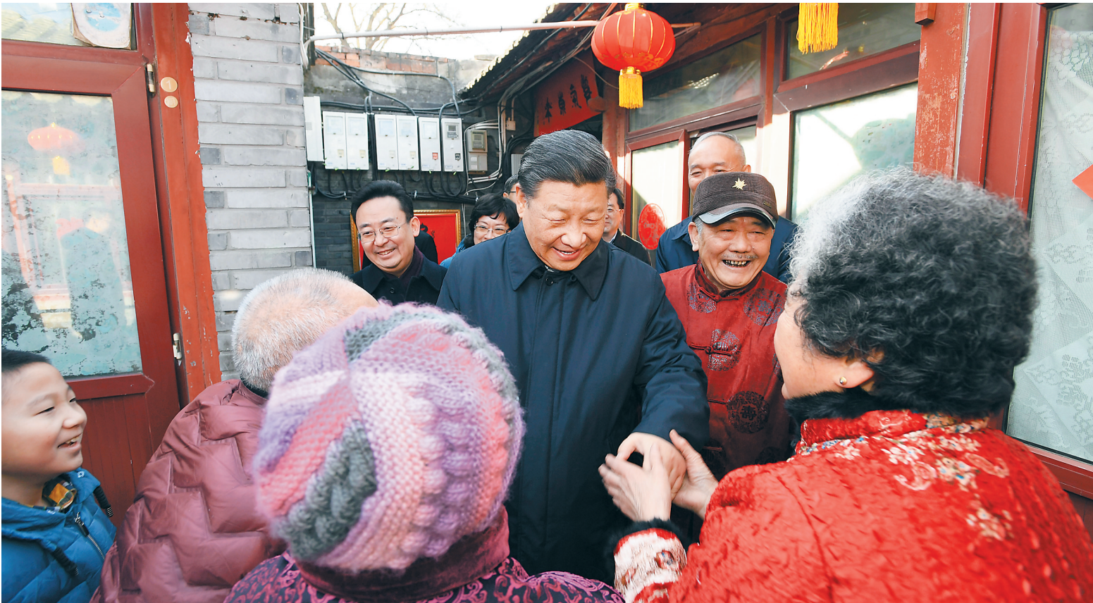
一日，习近平来到前门东区草厂四条胡同看望慰问群众。