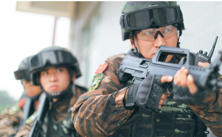
近日，武警雪豹突击队队员演练反劫持“人质”。

为祖国站岗，为人民守岁。 新春佳节来临之际，从东海之滨到西部大漠，从北国边疆到南国海岛，全军部队加强战备值班，狠抓练兵备战，开展丰富多彩的活动，既站好岗、放好哨、守好边，又确保官兵过一个快乐祥和的节日。 兵不解甲，箭不松弦。各战区、各军兵种、军委机关各部门和武警部队作战值班室内，值班人员紧张有序地忙碌着，指挥顺畅。各部队严守战备值班执勤制度，时刻做好应对突发情况准备，始终保持良好战备状态，确保一声令下，能够迅即出动，完成党和人民赋予的使命任务。 厉兵秣马，枕戈待旦。演兵场