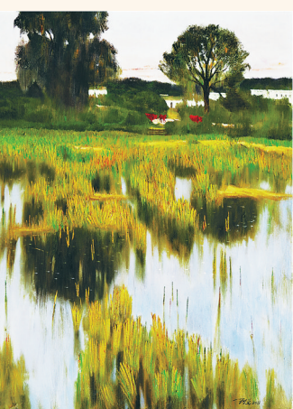
画家王锐作品《秋后的雨季》。

农村文化建设,一直是党和政府关心的大事,从中央到地方政府都很重视丰富农民的文化生活。近年来,海南文化下乡活动搞得红红火火。临近春节,送文化下乡活动更是丰富多彩,受到广大基层群众和社会各界的欢迎与支持。