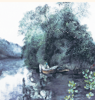
画家林峥明作品《早渔》。