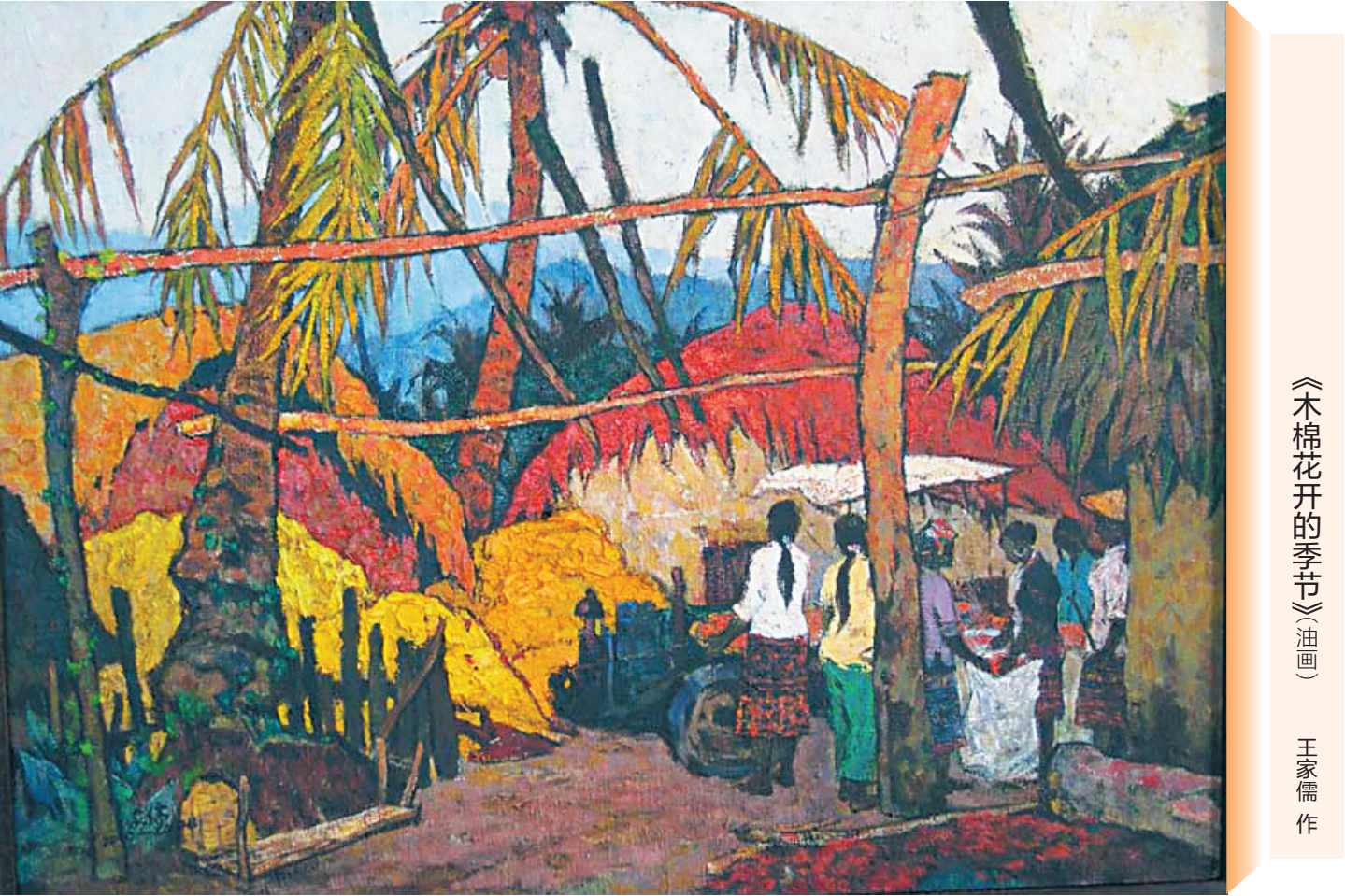
《木棉花开的季节》（油画）

清理到储物架的最底层，一个水果榨汁机，看说明书，2008年出厂的。我想起来，是某次