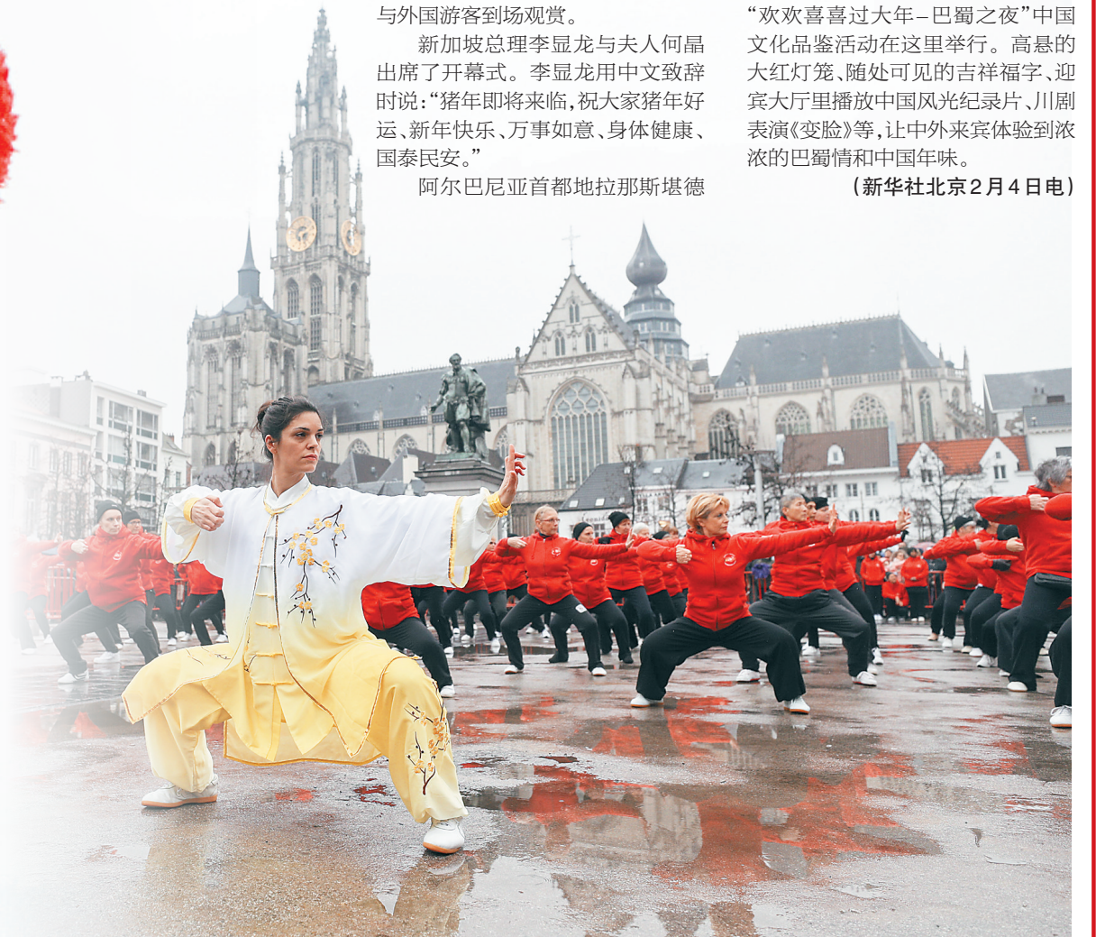
2月2日，比利时安特卫普市中心大广场，举行“欢乐春节”巡游表演。