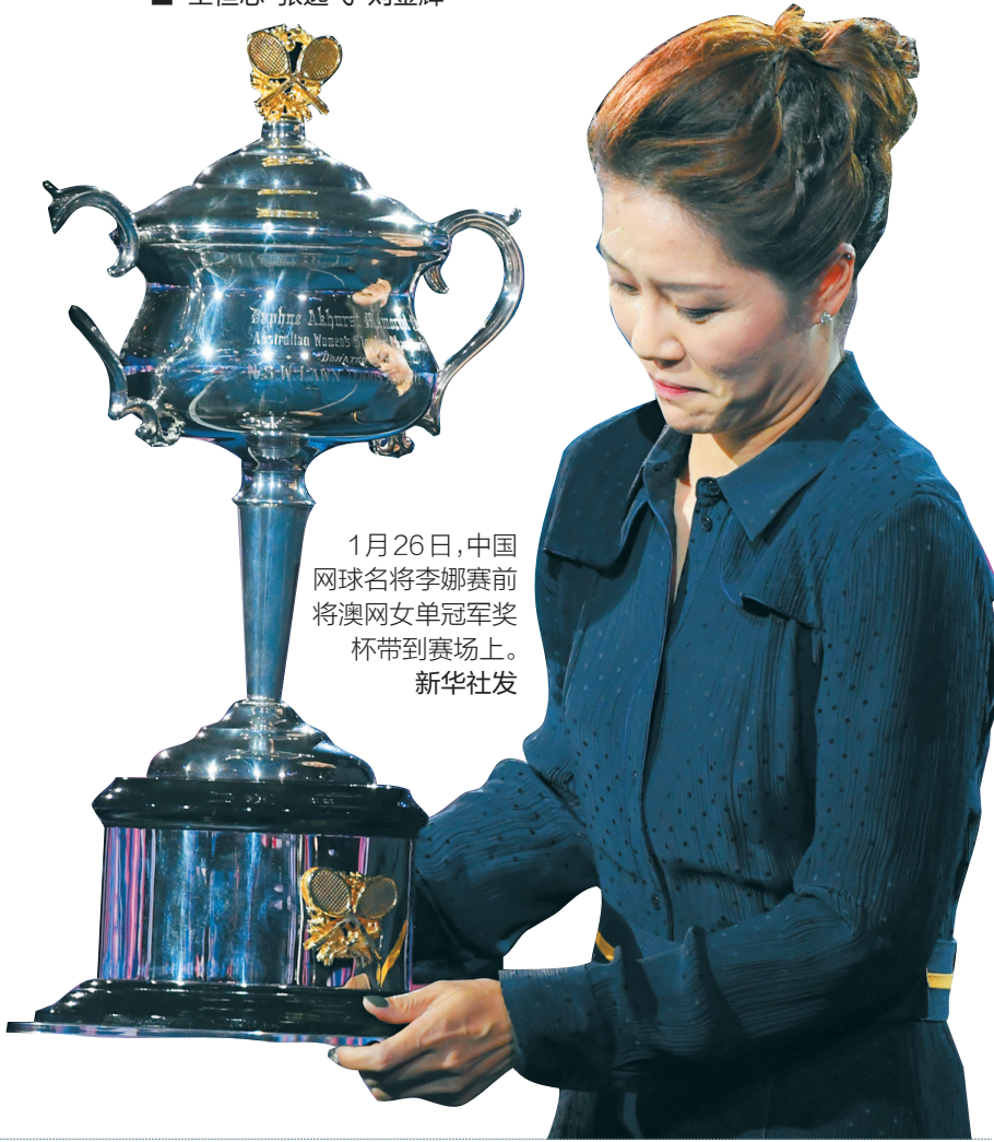
1月26日，中国网球名将李娜赛前将澳网女单冠军奖杯带到赛场上。

新中国成立近70年，中国体育从无到有，关于体育的春节记忆也日渐丰富。70年里，运动员们早已习惯了在春节期间训练、比赛，能在新春佳节里为国争光也成了他们和全国人民最美丽的春节记忆。而对更多中国人来说，他们正在春节期间成为体育的参与者，更进一步丰富了关于体育的春节记忆。