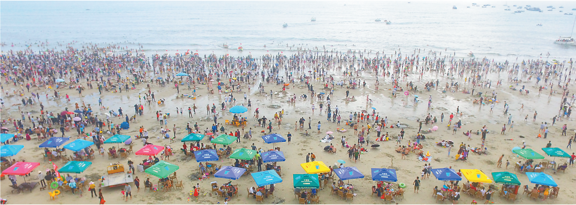
春节长假，人们走出家门走进自然，乐享山水好风光。图为游客在广西北海银滩休闲度假。