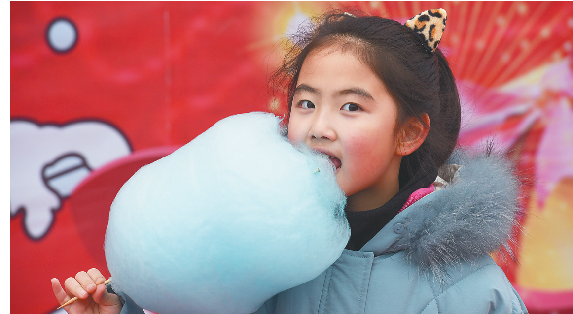
2月8日，游客在淮安清江浦庙会上品尝棉花糖。

商品消费更重品质。据商务部监测，春节黄金周期间，传统年货、绿色食品、智能家电、新型数码产品、地方特色产品等销售保持较快增长。安徽、云南重点监测企业家电销售额增长15%左右，河北保定、湖北潜江重点监测企业绿色有机食品销售额同比分别增长40%和18.6%。集购物、餐饮、娱乐等功能于一体的购物中心、奥特莱斯等新兴业态受到消费者青睐。各大电商平台坚持春节不打烊，让消费者在节日期间也能享受到便捷的网购服务。