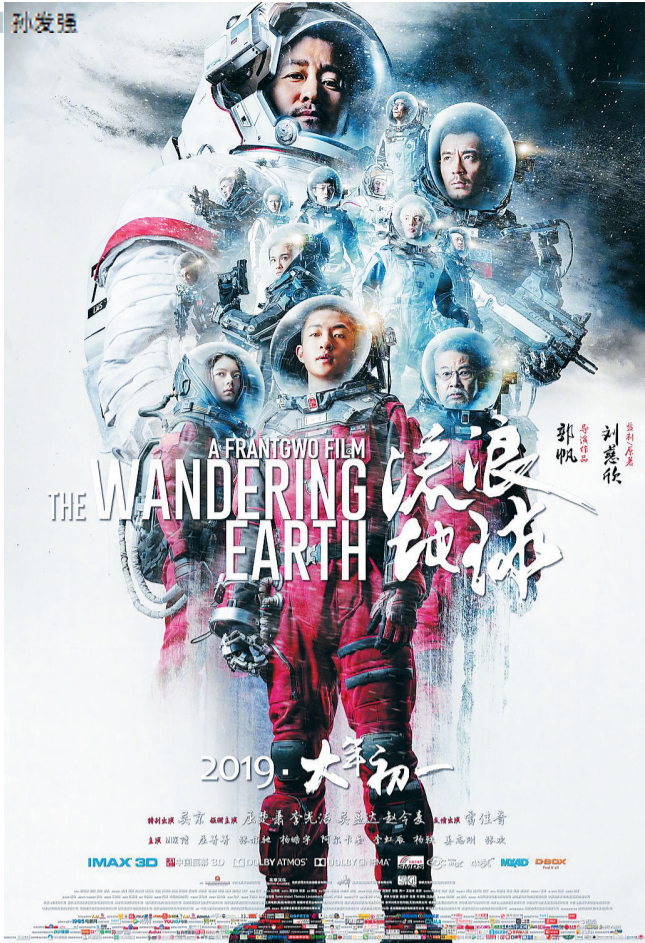
《流浪地球》以中国人熟悉的情感结构与审美方式，讲述了一个人类命运共同体的故事。

原上飞驰，曾经繁华的城市彻底荒废，行星发动机的等离子光柱直插云霄，末世景象让很多人都为之震撼。