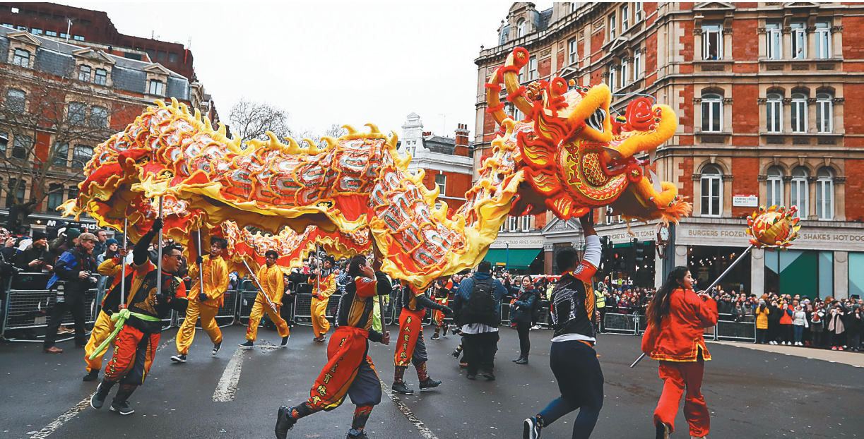
2月10日，英国伦敦表演舞龙。当日，伦敦举行新春巡游，共同庆祝中国农历新年。

当天活动中，维尔纽斯大学孔子学院带来的中国农历新年年份介绍、古筝表演、茶艺和武术气功表演等小镇带来浓浓的年味。