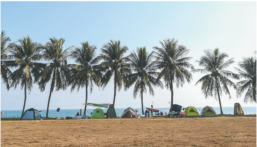
2月10日,万宁日月湾,游客在海边搭帐篷休息。

数据也印证了全域旅游的发展。国内在线旅游平台携程发布的《海南省春运数据分析》显示,往年酒店预订火热的城市如三亚、海口热度有所下降,而周边小城市酒店热度上升。处于大三亚旅游圈内的陵水、乐东的酒店预定量分别同比增长15.3%、17.5%,作为东部重要旅游城市的琼海则同比增长43.9%。