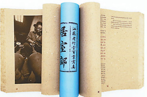
获奖书籍《江苏老行当百业写真》 资料图