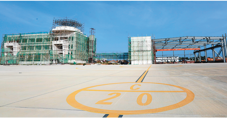
东方市通用机场正在抓紧建设中。

2018年,东方市地方一般公共预算收入完成13.95亿元,同比增长10.3%,其中税收收入10.34亿元,增长10.4%,非税收入3.61亿元,增长10.0%。据介绍,地方财政收入的增加,主要得益于工业税收的大幅增长和固定资产投资的增长,基本摆脱了对房地产业的依赖。