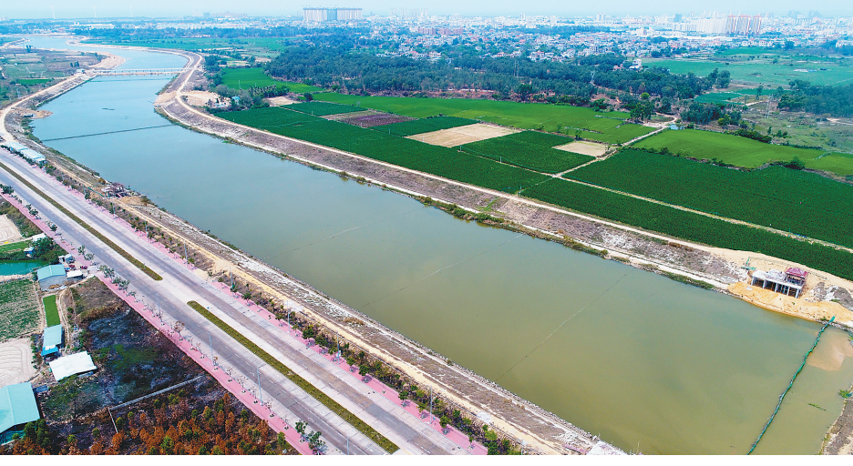
经过整治的东方市罗带河水清岸绿。