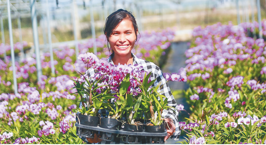
东方市湖南兰花种植农民专业合作社,让贫困户转型升级为技术农户,实现就业增收双向收益。