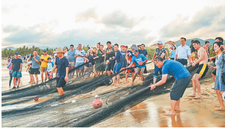
入住日月湾森林客栈的游客体验拉网捕鱼。

对于许多游客来说，入住民宿就是为了体验当地的生活方式。在在线旅游平台上，可以看到网友给三亚