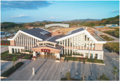
白沙黎族自治县图书馆。

白沙是魅力之城，民俗风情浓郁。白沙是海南黎族文化的发祥地之一，文化底蕴深厚，民俗风情浓郁，民族文化灿烂。 据悉，白沙“黎族传统纺染织绣技艺”被列入联合国非物质文化遗产保护名录，“老古舞”“黎族泥片贴筑制陶技艺”被列入国家级非物质文化遗产保护名录，其中“双面绣”织绣技艺独特，正反两面花纹图案完全一致，民族特色鲜明，是中国纺织艺术的一朵奇葩。此外，传承千年的“三月三”黎族苗族传统节日活动、热情奔放的黎族苗族山歌对唱、风味独特的千米长桌宴、妙趣横生的婚嫁民俗，处处彰显白沙热情好客、能歌善舞的黎苗民族风情。