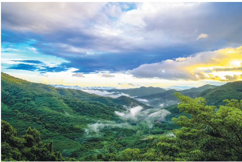
俯瞰位于白沙的鹦哥岭国家级自然保护区。

白沙是生态之城，养生度假天堂。440座山岭与30条河流交相辉映，水傍山绕、山水相依，常年云雾缭绕，风光优美、生态宜人。 南渡江、珠江、石碌河三大河流均发源于此，境内有鹦哥岭国家自然保护区、霸王岭国家自然保护区，森林覆盖率高达83.47%，冬无严寒、夏无酷暑，是名副其实的热带天然大氧吧，荣膺“2017年全国百佳深呼吸小城”称号。