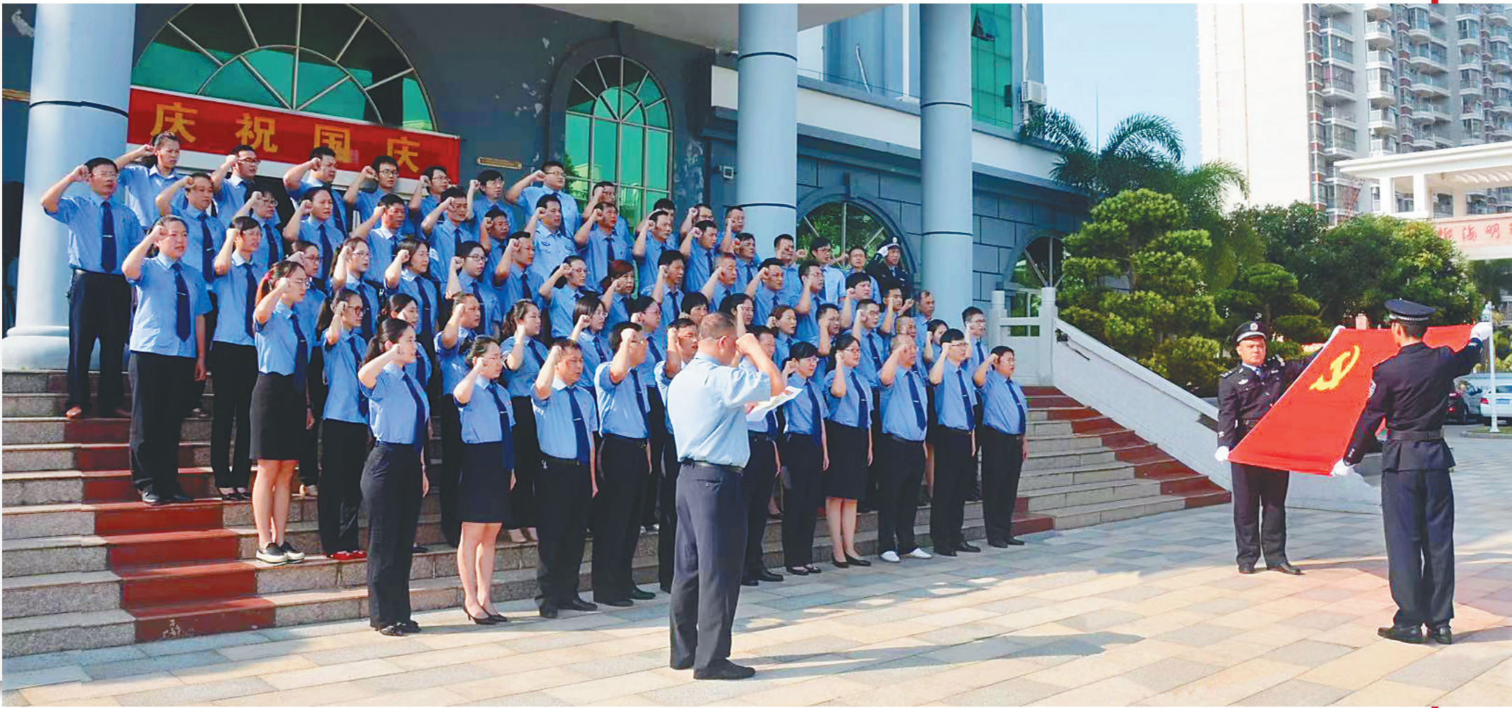
文昌市检察院干警集体宣誓。

近期,在庆祝检察机关恢复重建40周年暨全国检察机关第九次“双先”表彰大会上,文昌市检察院被授予“全国模范检察院”荣誉称号,为海南检察系统争得了荣誉、增添了光彩,更为海南改革发展增添了正能量。 据悉,全国检察系统“双先”表彰大会每四年评选一次,坚持面向基层和工作一线,是检察机关最高层次的综合性表彰奖励活动。近年来,文昌市检察院在省检察院和文昌市委、市政府的领导下,深入学习贯彻习近平新时代中国特色社会主义思想,认真贯彻党的十九大精神,紧紧围绕“讲政治、顾大局、谋发展、重自强”新时代检察工作总体要求,忠诚履责,推动各项检察工作稳步发展。