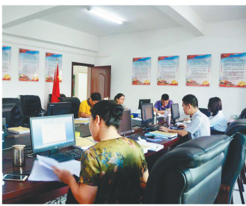
文昌市检察院干警正在办案。