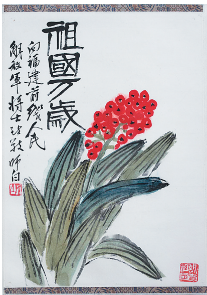
姜师白中国画《祖国万岁》

1952年,37岁的董希文受命完成《开国大典》。这幅油画作品以现实主义和浪漫主义相结合的手法,表现了1949年10月1日毛泽东主席宣布中华人民共和国成立的历史瞬间,成为“开国大典”题材绘画的经典之作。