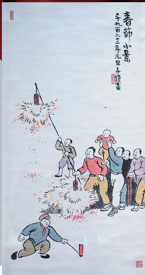
丰子恺画作《春节小景》