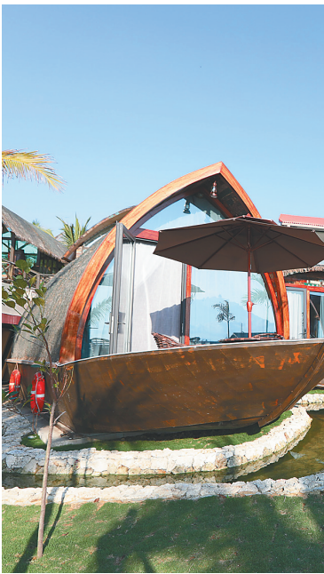
陵水英州镇赤岭村的船屋民宿。

为主，让食客品尝最原汁原味的海鲜。渔家鱼丸是最推荐品尝的佳肴。将新鲜的马鲛鱼肉手工剁碎，加盐、生粉等佐料拍打成肉泥，捏成一个个圆滚滚的鱼丸。鱼丸可煎可煮，用来涮火锅最受欢迎，鲜美Q弹。 除了品尝海鲜，在赤岭村，游客还能赶渔集。当地渔民通常晚上出海捕鱼，清晨带着夜里的收获回到码头。每天早上7点左右，赤岭村的码头就开始热闹起来，一筐筐海产品被运往岸上，叫卖声此起彼伏，吸引四周的居民前来购买。 赶渔集、吃海鲜、观海，如果意犹未尽，那不妨在赤岭村住上一晚。这里有一家海景温泉船屋民宿，拥有6间渔船造型房间，形象逼真，住在里面就仿佛住在船里。船屋两旁种上了三角梅，底部修建了水池，鲜花掩映中金鱼欢快游动，环境优美惬意。 这里最独特的，当属海景温泉。一栋三层小洋楼，外表上并不起眼，里