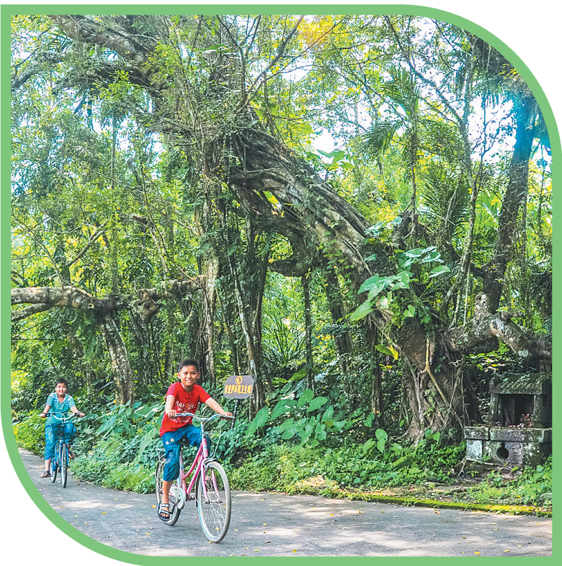
定安岭口皇坡村，孩童在树下骑行嬉戏。

最是——一年春好处。 春来了，万物复苏、万象更新，绿岛海南处处盛开春的风情。在定安岭口，绿色田野中鹭鸟翩跹舞，构成一幅充满诗情画意的田园风景画；万宁日月湾，海潮涌动春的旋律，细细诉说海的故事；昌江七叉迎春绽放的木棉花，带来的是新一年红红火火的美好祝愿……海岛上各地美景正迎着春风向游客发出邀请、敞开怀抱。 趁着春光正好，不妨寻一处春景旖旎之地深呼吸，来一场踏青之旅，感受一下采摘游玩，赏花踏青的乐趣。