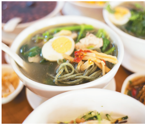
鸡屎藤汤面。

说起鸡屎藤，人们熟悉的吃法是做成粿蒸熟，或是搓成橄榄状的球入甜汤。在儋州有这么一家“网红店”，却做出了鸡屎藤面，使得鸡屎藤不仅可以做成小吃甜品，还能成为三餐的主角。 中午时分，走进这家“网红店”，带有田园装修风格的小店里，座无虚席。小店里氤氲着食物的香气，三五成群的客人点了各色的儋州小吃，摆满一桌子拍照、品尝。作为“网红店”的招牌之一，鸡屎藤面的点单率颇高，所以自然是要试一试。 鸡屎藤的名字听起来不雅，若非是海南本地人，怕是早就被这名字吓跑。实际上，鸡屎藤是一味中药，作为蔓藤类植物的一种，鸡屎藤的叶子用手揉烂，初闻有一股鸡屎味，才得此名字。但鸡屎藤久闻之后有一股沁人肺腑的清香，有祛风除湿、消食化积、美容养颜、解毒活血等功效。因此在民间，老百姓当鸡屎藤是宝，也管它叫土参。 “网红店”里鸡屎藤面的主料之一就是鸡屎藤叶。做法简单，将鸡屎藤叶晒干磨粉后加高筋小麦粉和匀，再制成面条。加入鸡屎藤的面条看上去是绿色的，捧起一把，草叶的幽香淡淡而来。这样的气味并不难闻，相反，绿色、清新，更让人产生一种这是健康食物的想法，从而跃跃欲试。 店里的鸡屎藤面有两种做法，汤面及拌面，汤面又有排骨鸡屎藤面和鸡肉鸡屎藤面两种。厨房里，大锅里的开水滚滚，一份面只需要余上两分钟就能出锅。出锅的面占了海碗的大半，此时得加上熬制好的高汤和肉块。而这碗鸡屎藤汤面里，辅料也颇为丰盛。青菜叶、木耳、芹菜、香菜及半颗水煮蛋将碗填满，上桌时还在小碟子里单独加上一份辣笋条。