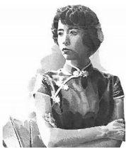
1883年，吕碧城生于安徽旌德。

阳春三月，一个春色迷人的花园里，一位儒雅的父亲，手牵着一个幼小的女儿，在湖边小路上游玩。湖面波光粼粼，路边柳枝随风飘舞。小女孩儿忽然看到一丛粉红色的月季花，上面停着一只漂亮的黄色蝴蝶，她挣脱父亲的手，哒哒哒快跑过去。到了跟前，蹑手蹑脚地伸手去抓，蝴蝶一下子飞走了。小女孩儿跑着去追，可蝴蝶越飞越高，越飞越远。小女孩儿站在那儿出神地看着。这时，父亲慢慢走过来，拉住女儿的小手，温和地说：“让它自由地飞吧！”父女俩继续往前走。走着走着，父亲看着和风中的柳条，随口吟出一句：春风吹杨柳。小女孩脱口而出：秋雨打梧桐。听到此，父亲惊喜地瞪大了眼睛，女儿才五岁，居然如此才思敏捷，出口成诗。