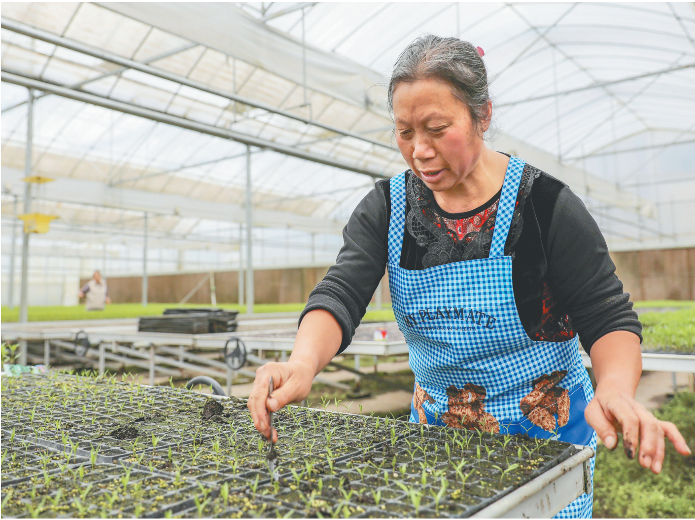
3月9日,安顺关岭供港澳蔬菜育苗基地,工人正在分拣幼苗。近年来,关岭结合自身气候特点,瞄准港澳市场,加快建设供港澳蔬菜育苗基地,逐渐成为港澳地区的“菜园子”之一,早熟蔬菜成为当地村民脱贫的一项重要产业。