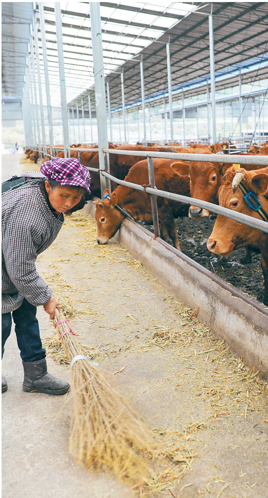
3月9日,安顺关岭“关岭牛”保种场内,工人正在清扫饲养场。关岭牛是当地特色品牌,群众可以养牛致富、种草卖钱,还可以到加工厂就业,或入股合作社成为股东。