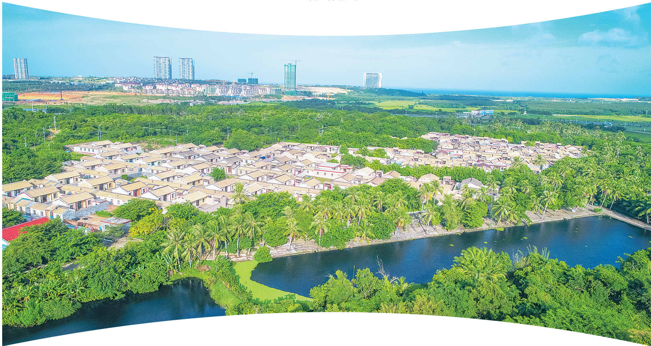
文昌市昌洒镇白土村,绿树碧水环绕民居,成为一处独具魅力的旅游驿站。