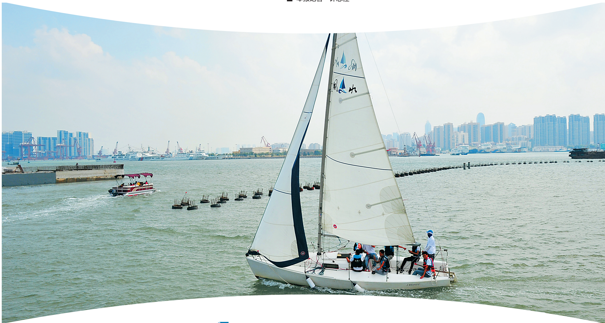
市民游客在海口西秀海滩体验帆船帆板运动。