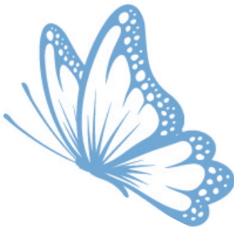
《梁祝》中的蝴蝶被誉为“中国灵魂”。