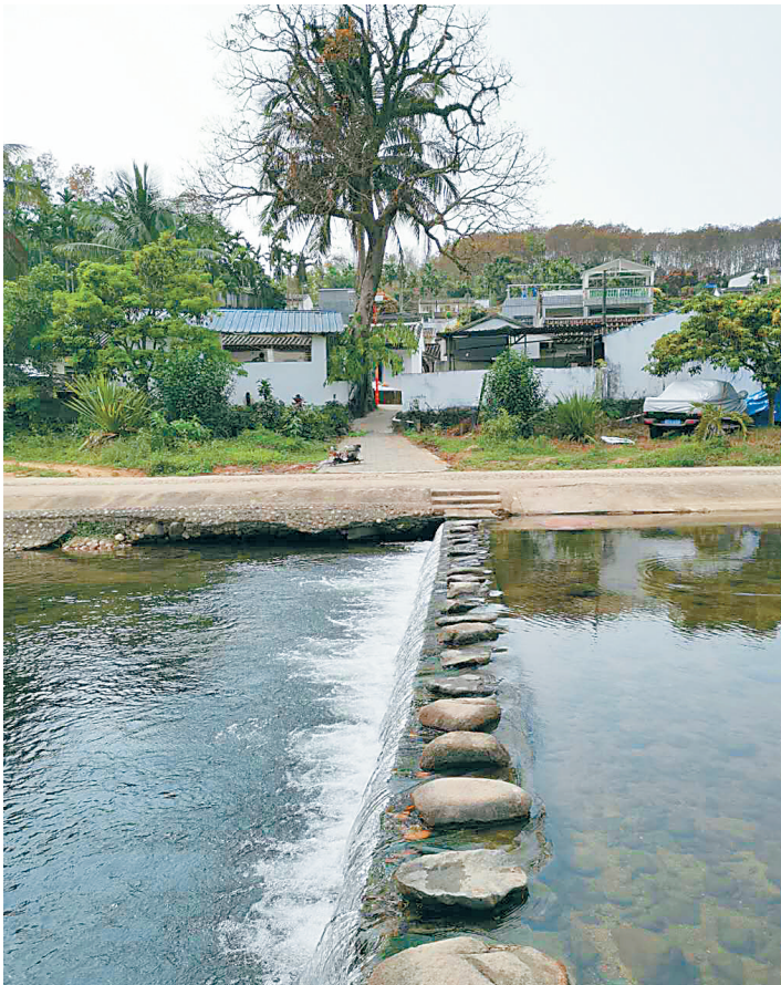
经过治理,吊罗山乡响土村水流变得更加清澈。本报记者 于伟慧 摄