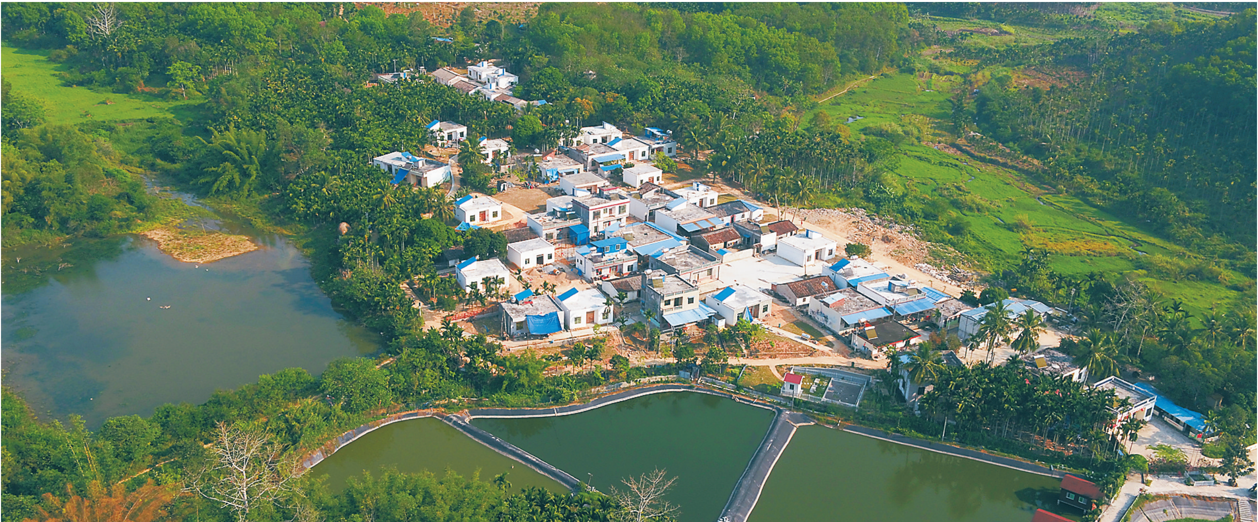
山水环绕的红毛镇金屏村,经过改善人居环境,变得更加秀美。