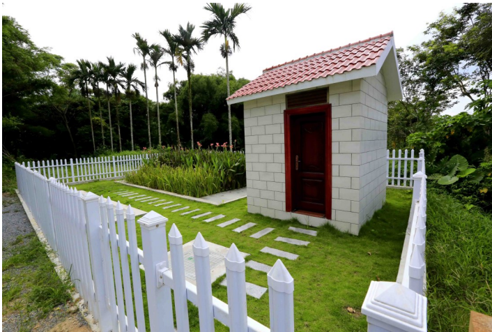
湾岭镇水央村如今建成了“人工湿地”污水处理系统。