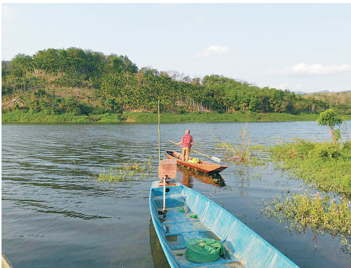
和平镇埗对村村民在清理水道漂浮物。本报记者 于伟慧 摄