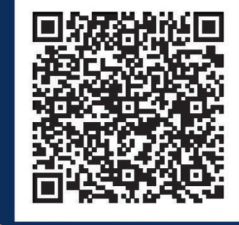
附中海口学校国际部

北京大学附属中学海口学校 招生电话：0898-6861 3888 国际部电话：010-5875 1192 (北京) 0898-6861 2619 (海口) 地址：海口市秀英区椰海大道与永万路交汇处