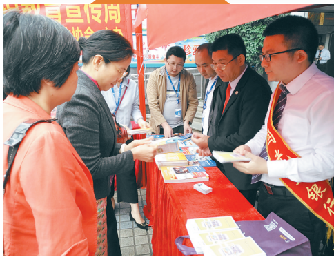
海南保险业工作人员走上街头向市民普及金融知识。

2018年,海南保险消费者满意度为 98.35% 。保险消费投诉咨询 2686 件,保险消费投诉办结率 100% ,维护保险消费者经济利益 1146.43 万元。