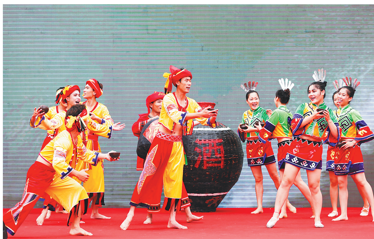
陵水群众庆祝“三月三”。

今年的“三月三”主会场活动,陵水启动了民族风情街项目,一度成为此次“三月三”活动的“重头戏”。据了解,该项目分为农夫集市、美食集市、