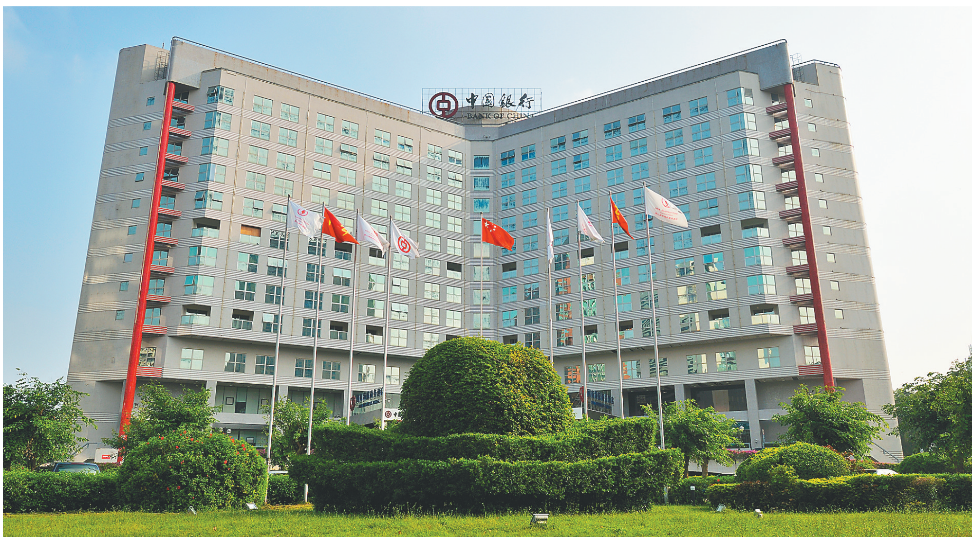
位于海口市大同路上的中银大厦。