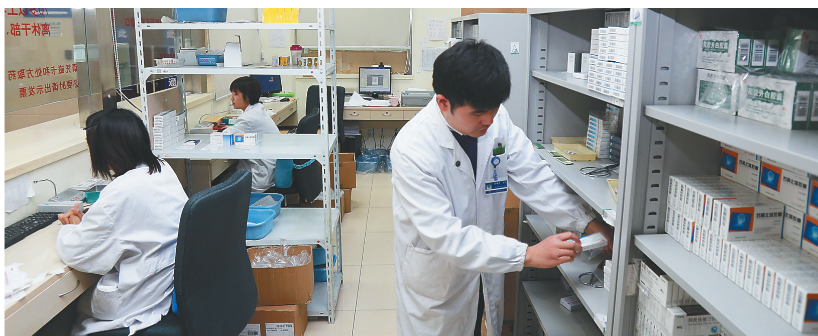
上海市胸科医院的门诊药房(4月11日摄)。

上海市卫生和健康发展研究中心主任金春林表示，通过带量采购，以量换价，药品费用的价格趋向合理。大量的医保资金被合理地节省下来，同时诱导服务和过度浪费等灰色空间也得到了压缩。