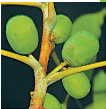
南酸枣的果核可以做成五眼六通菩提。