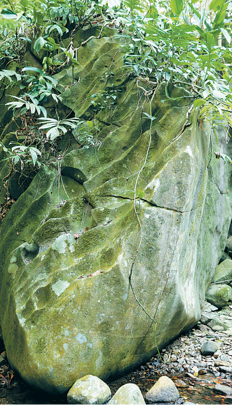
山中有奇石。