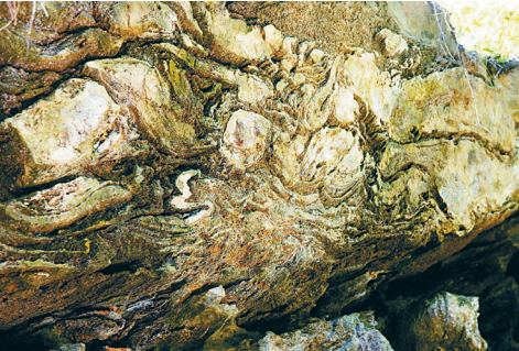
山中顽石也清凉。