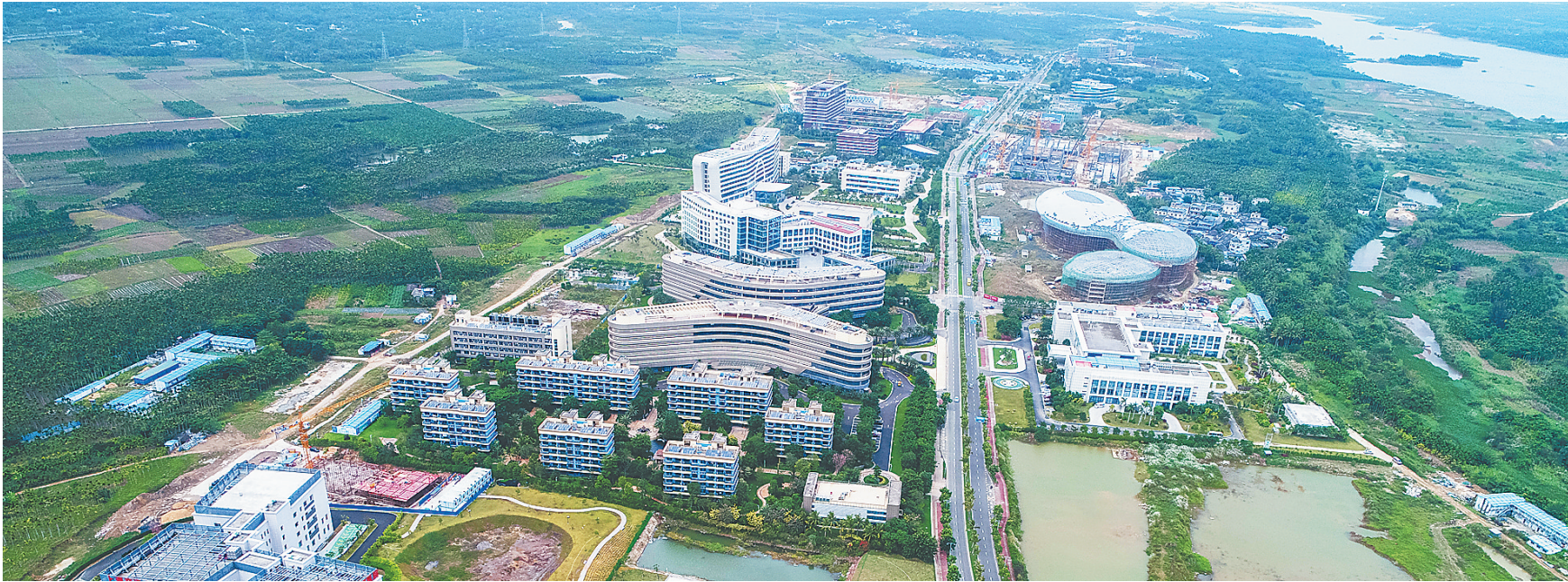
博鳌乐城国际医疗旅游先行区。