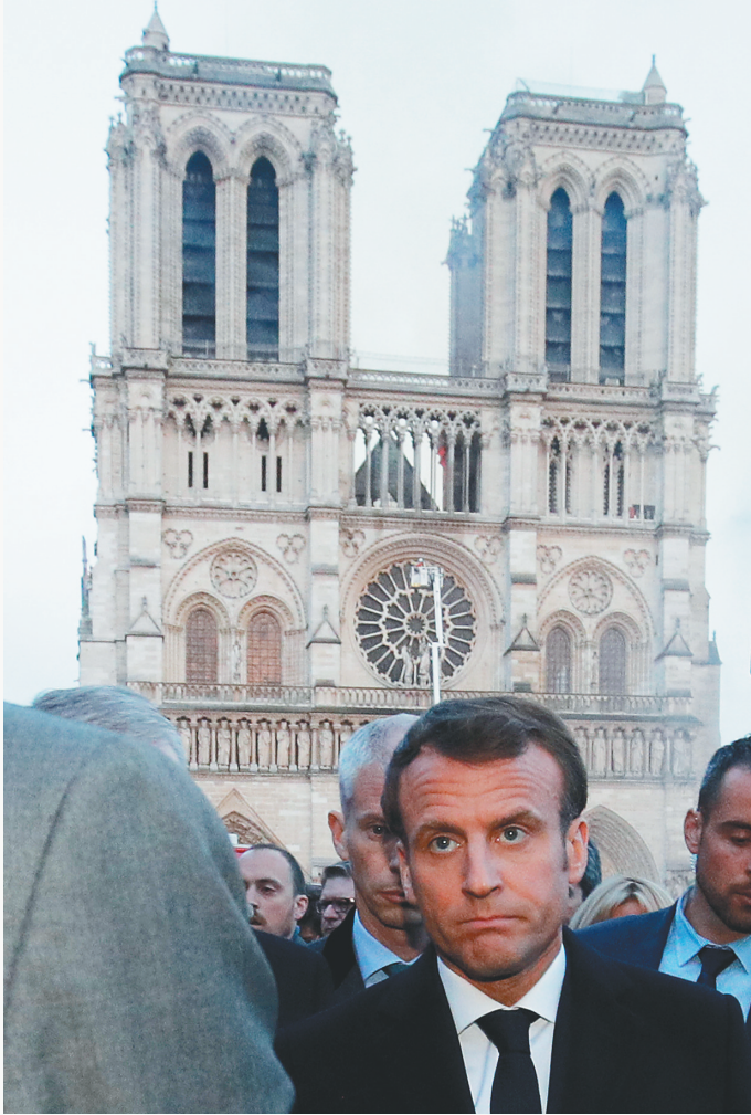
法国总统马克龙抵达起火的巴黎圣母院。

的场馆安全状况。 “这敲响一次警钟,”西班牙文化部长何塞·吉劳16日说,“危险总是出在老化的供电系统,必须检查。” 吉劳说,他16日将与法国文化部长通话,看看西班牙能做点什么,“眼下,精神支持最重要”。 闫洁(新华社专特稿)