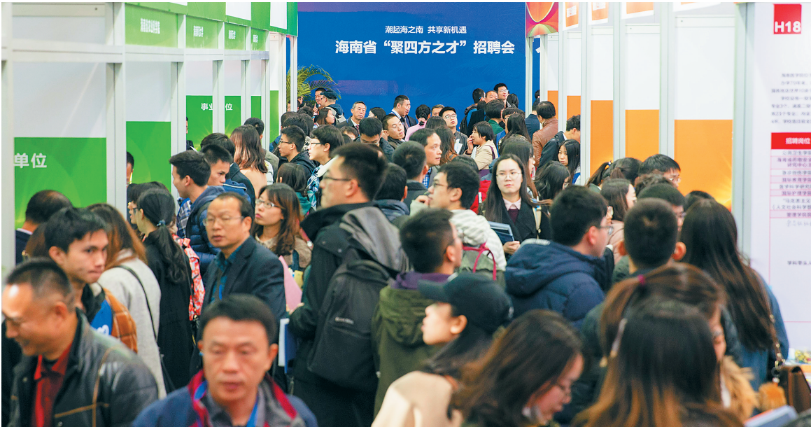
2018年11月10日，海南省“聚四方之才”招聘会在北京举行，吸引了大批人才前往应聘。