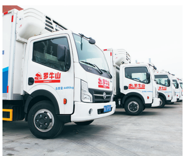
罗牛山冷链物流园车队。

《中国(海南)自由贸易试验区总体方案》明确要求：加强冷链基础设施网络建设，打造出岛快速冷链通道，提供高质量的冷链快递物流服务。把冷链物流服务上升到海南自贸区建设的重要层面。在海南自贸区、自贸港建设的大背景下，海南的冷链物流等相关行业、产业将会迎来前所未有的发展机遇和驱动力。 2018年12月12日，罗牛山冷链物流园盛大开园。作为海南冷链物流综合园区，罗牛山冷链物流园位于海口江东新区，具有明显的区位优势。其完善的装备设施、管理系统、服务体系、供应链管理平台，将为海南自贸区建设提供高质量的冷链快递物流服务。