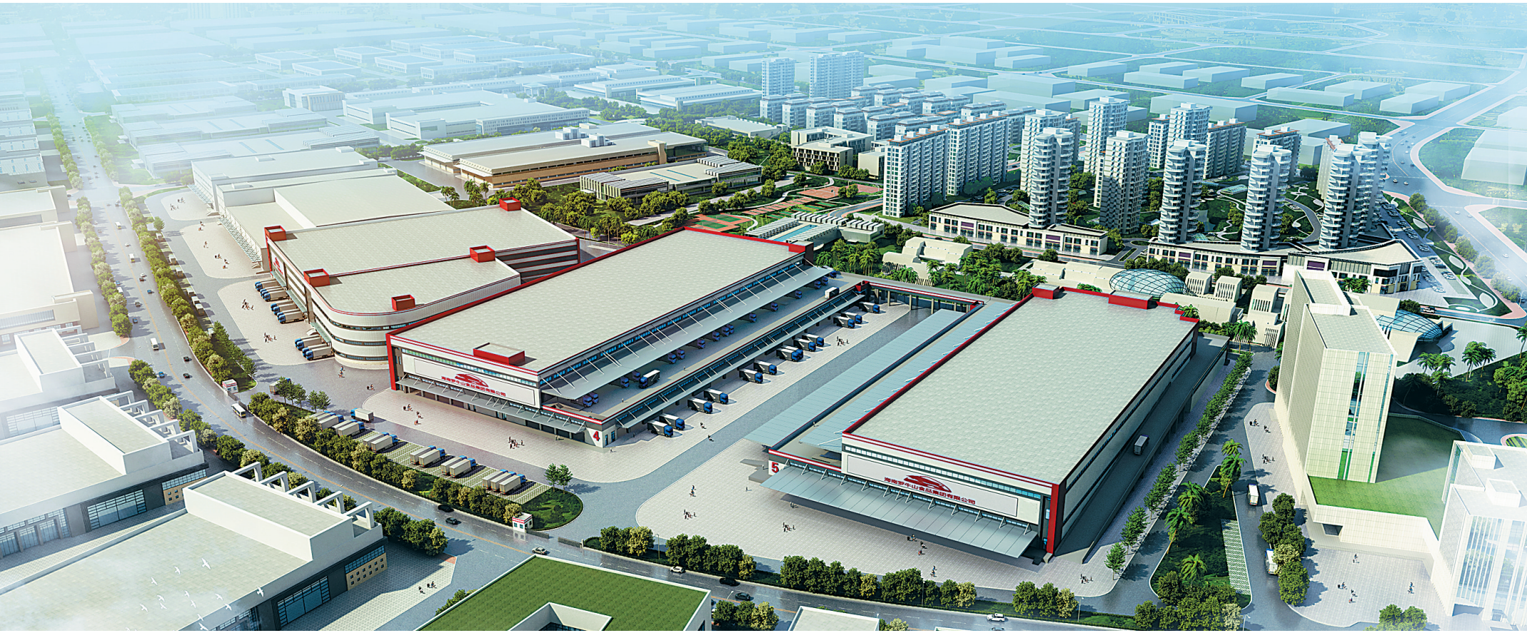
罗牛山冷链物流园。