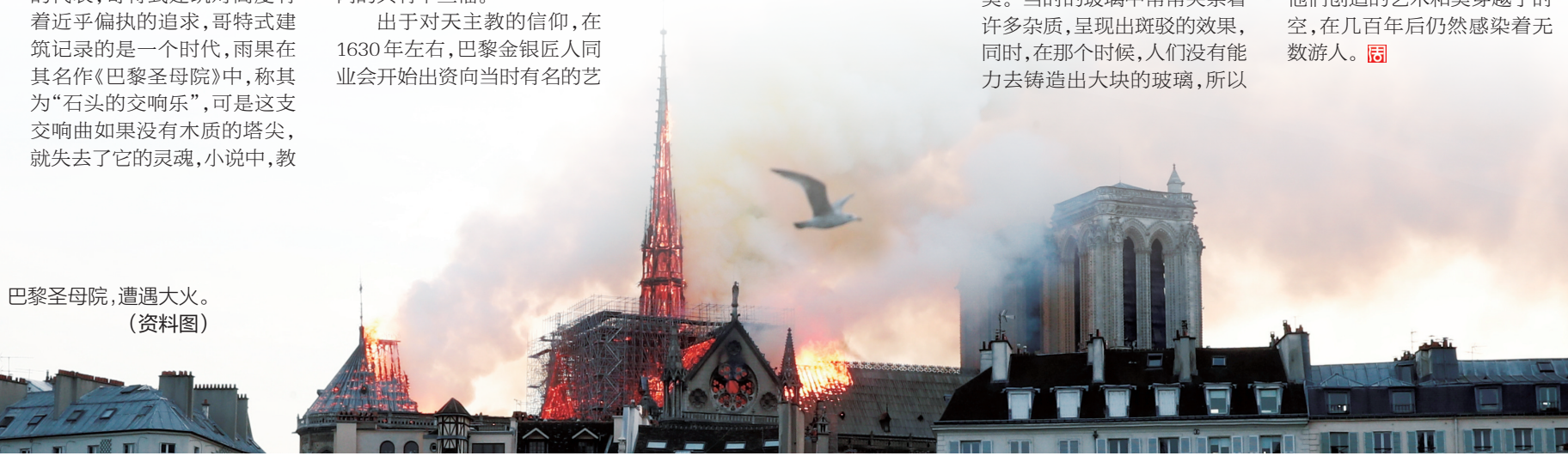
巴黎圣母院，遭遇大火。 (资料图)

如果需要大块玻璃，就只能用许多小块来拼凑。而这正成就了玫瑰花窗，由于没有整片的大玻璃，工匠在建造铁窗棂的时候将其分割的格外细致，在每一个格子内，细碎的玻璃片折射出来的太阳光更加斑驳，并且有时会产生一些出人意料的效果。而在十三世纪之后，由于大块玻璃的出现，窗棂变得大了起来，玻璃本身也显得更明净，但是，其中的装饰性和艺术性也相对被削弱，这不得不说是个遗憾。 在这次火灾中，虽然花窗有所损毁，但是最具艺术价值的三个花窗却安然无恙，这不得不说是个奇迹。 圣母雕像感染着无数游人 巴黎圣母院内，许多雕塑静静地立在那里，无声地为游人们讲述着这个城市的历史，这也是这座古建筑里最为引人瞩目的宝藏之一。 在这次火灾中，雕塑具体损毁情况不明，不过，如果他们都能安好，那该是我们人类怎样的幸运啊！ 巴黎圣母院内最著名的雕像恐怕就是那个住在钟楼上的怪兽“思提志”(stryc)了，它是一种来自中东一带的精灵，悬在巴黎圣母院高达四五十米的钟楼之上，在暗夜里守护着这座城市。 如果说思提志的塑像略显狰狞的话，那么圣母的塑像则显得无比慈祥。巴黎圣母院中当然要有圣母雕像，这座雕像可以说是这里的核心。自十二世纪初巴黎圣母院落成，这座圣母像就被安放在祭坛当中。圣母的雕塑惟妙惟肖，有作家称“她幸福的笑容绽放在忧郁的嘴唇上”，还有许多人在看到这座雕像之后内心得到了陶冶和净化，曾经的阴霾和忧虑被一扫而空。这些与其说是圣母显灵，倒不如说是当初塑造这些雕像的能工巧匠们的功劳，他们创造的艺术和美穿越了时空，在几百年后仍然感染着无数游人。👍