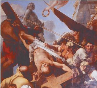
巴黎圣母院内的大型油画

堂的敲钟人卡西莫多就是爬上了这座高高的塔尖，和邪恶的副主教克罗德做殊死搏斗的。可以说，这座主塔塔尖，是整座圣母院最引人注目，也是最广为人知的艺术品。 但是我们今天看到的塔尖并不是卡西莫多和克罗德搏斗过的那个地方。1787年，由于大革命，巴黎圣母院的原装塔尖损毁，但由于法国国内一直风云未定，损毁后的塔尖一直未能得到妥善修复，直到1844年，建筑师奥莱·勒·杜克才开始对塔尖进行修缮。这位杜克先生不仅是一位修复建筑的行家里手，更是一位优秀的历史学家，经过他的推算，在还原巴黎圣母院原貌的同时，还为教堂和塔尖之间找到了更合理的搭配比例，在他的建议下，塔尖被提升了13米，达到了现在93米的惊人高度，但是结构却更加牢固了。这项工程持续了23年，成为了一个时代的标志。 虽然勒·杜克曾经说：“修复的目的是让建筑重现已经被剥夺的丰富和光彩。在修复中，艺术家应该遵循的原则是将自己完全抹去，忘记自己的品位，自己的直觉，来研究自己的修复对象。”但是巴黎圣母院的塔尖，却成为了杜克建筑生涯的巅峰。也许，巴黎圣母院在这次浴火之后，还能够从杜克这里找寻到重生的路径。 画作《五月》也许永远告别了 在巴黎圣母院的中殿礼拜堂内，陈列着一些巨幅画作，这些画以天主教为题材，形成了一个系列，平均每幅画都高达四米左右。 在这次火灾中，最令人揪心的就是这些画作了。这些画作原本有七十六幅，早在法国大革命时期，由于动荡的局势和纷飞的战火，有六幅已经遗失，其他的则在不同的历史时期被转移到了卢浮宫等地，在火灾之前，保存在巴黎圣母院内的共有十三幅。 出于对天主教的信仰，在1630年左右，巴黎金银匠人同业会开始出资向当时有名的艺