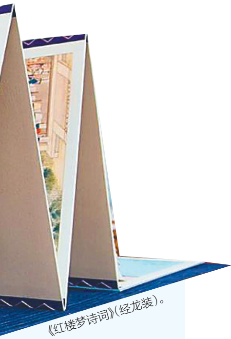
《红楼梦诗词》(经龙装)。