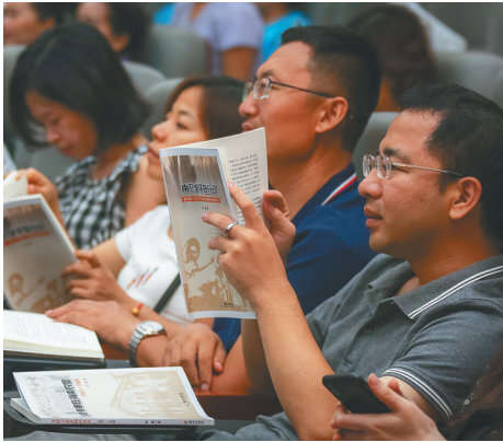
海南橡胶历史文化丛书受到读者欢迎。

“上世纪五十年代初，刚从部队转业过来的军工们都是二十出头的小伙子，他们听从党中央‘建设海南，保卫海南’的号召，扎根山区，垦荒殖胶，几十年如一日，垦殖了上百万亩的胶林，为打破西方国家对我国橡胶的封锁，发展中国天然橡胶事