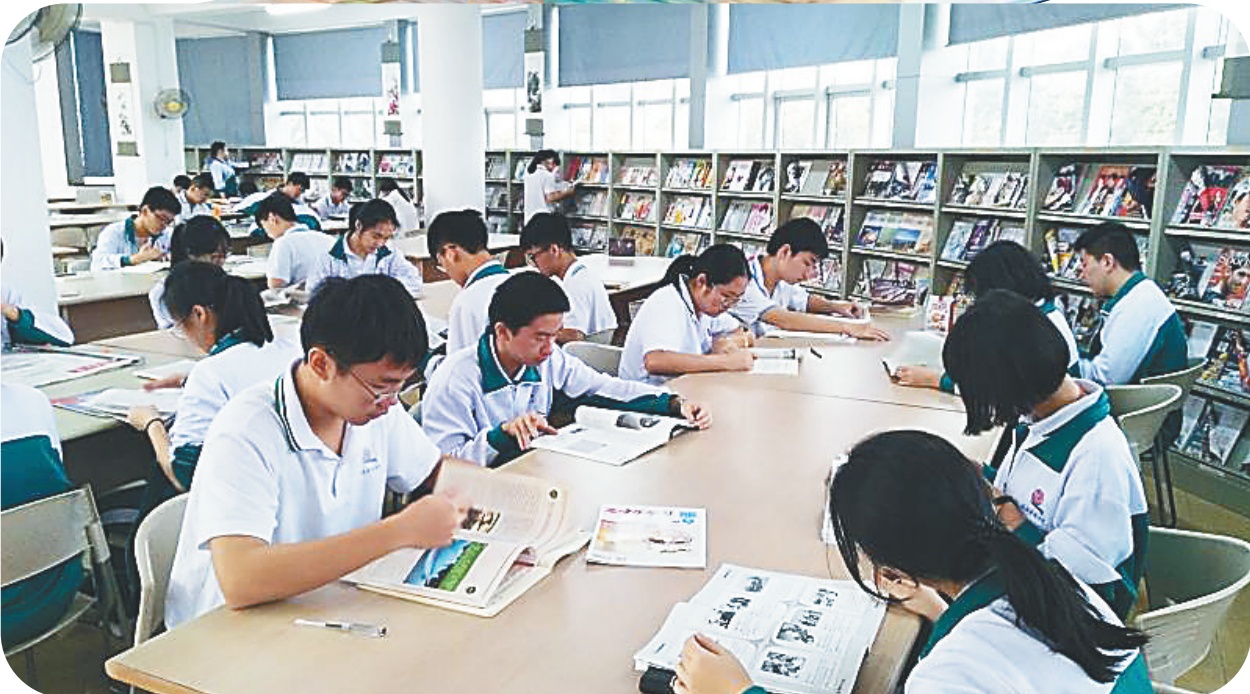
海南华侨中学阅览室，学生们在阅读。