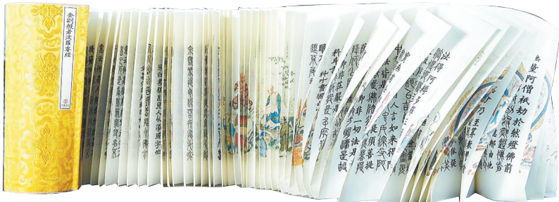
源于唐代的精美龙鳞装古籍。