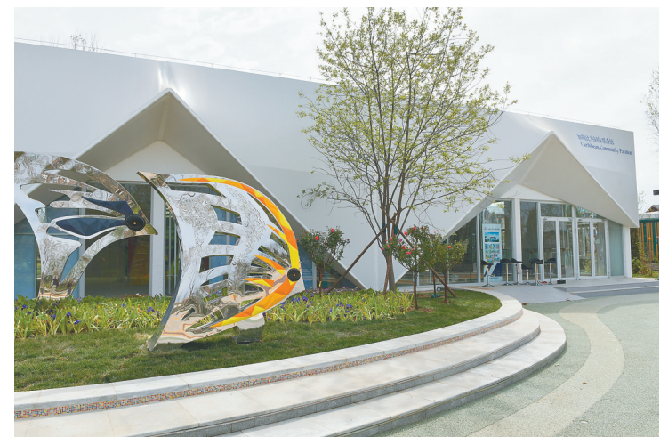
加勒比共同体联合园