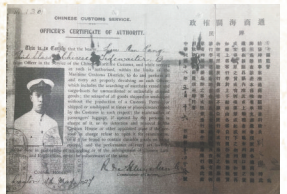
琼海关稽查人员工作证。