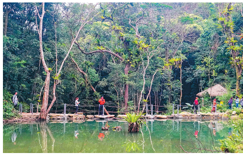
百花岭秀美风光引来八方游客。

值得一提的是,位于琼中和平镇合口村的琼中峡漂流不久前刚刚开业,推出空中漂流、山水天地、儿童漂流、亲子拓展、峡谷拓展、索溪探险、农耕农作、真人CS、露营等项目,也将带给游客一趟惊险与刺激的狂欢之旅。(撰文/孟瑶 陈欢欢)