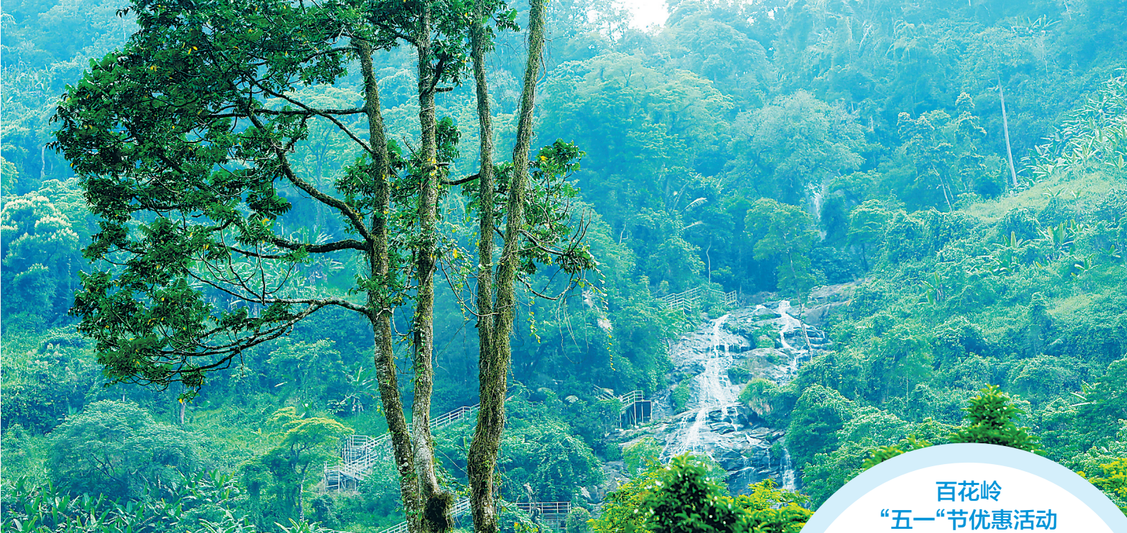
琼中百花岭雨林文化旅游区景色宜人。

的时间越来越少,从而导致了一系列行为和心理学上的问题,如孤独、焦躁、易怒,沉迷电子产品、注意力难以集中等。